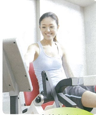
高齢者向け フィットネス機器