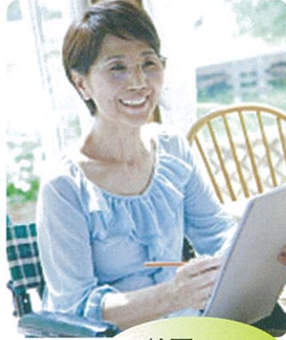
絵画・ 絵手紙教室