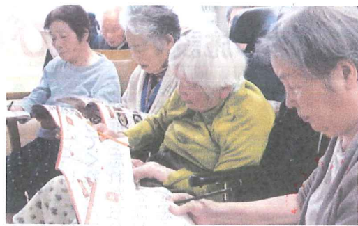
傾眠の傾向が強い方や徘徊の頻度が高い方も、授業形式のレクリエーションでは集中して取り組まれています。

「おとなの教科書」には、国語・算数・理科・社会など9科目と課外授業が用意され、話題が豊富。「教科書」という言葉は、難しいようにも聞こえますが、実際に授業形式のレクを受けてみると、皆様の思い出話を伺う内容となっているため、若かりしあの頃の